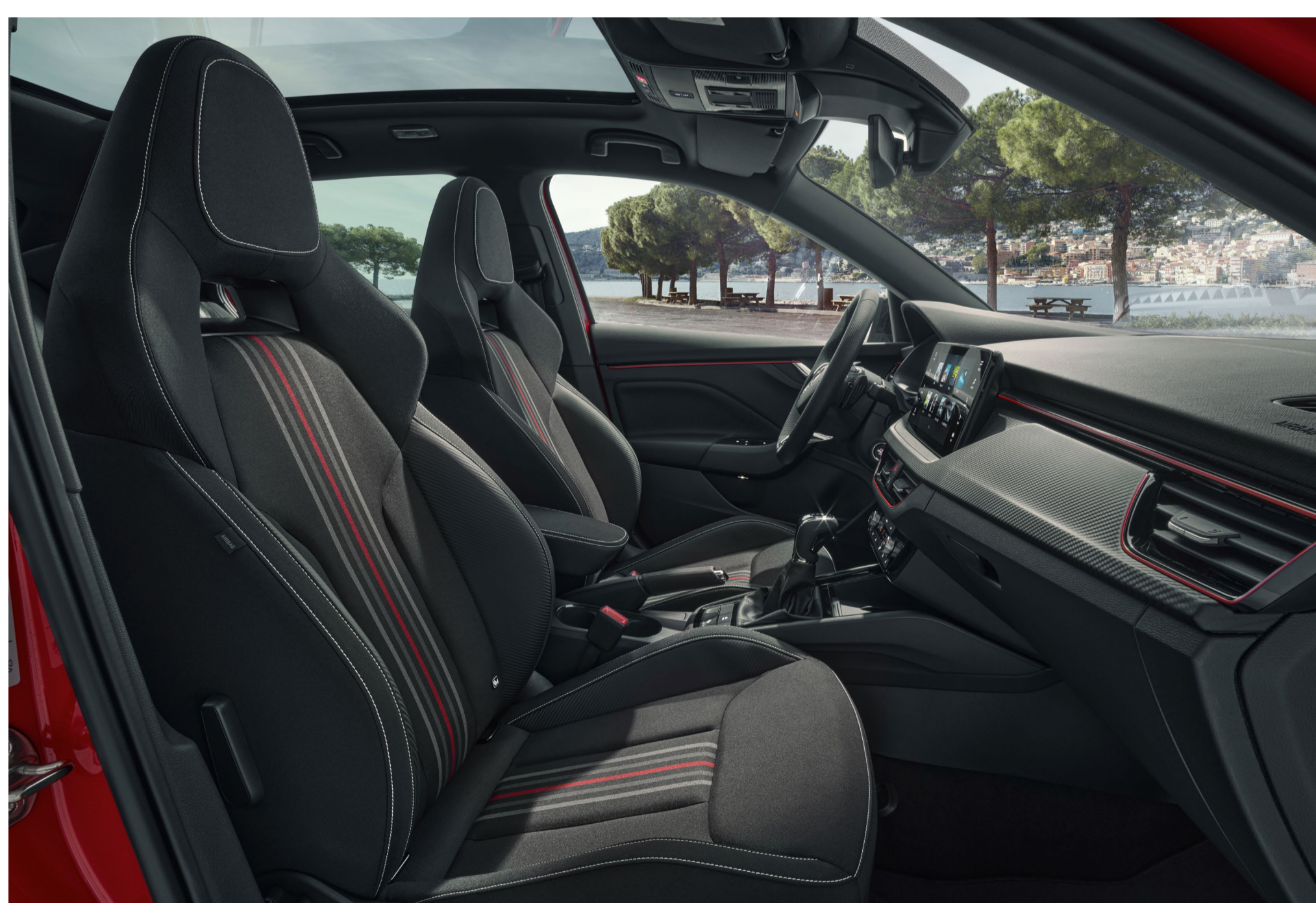
Interjeras „Monte Carlo“