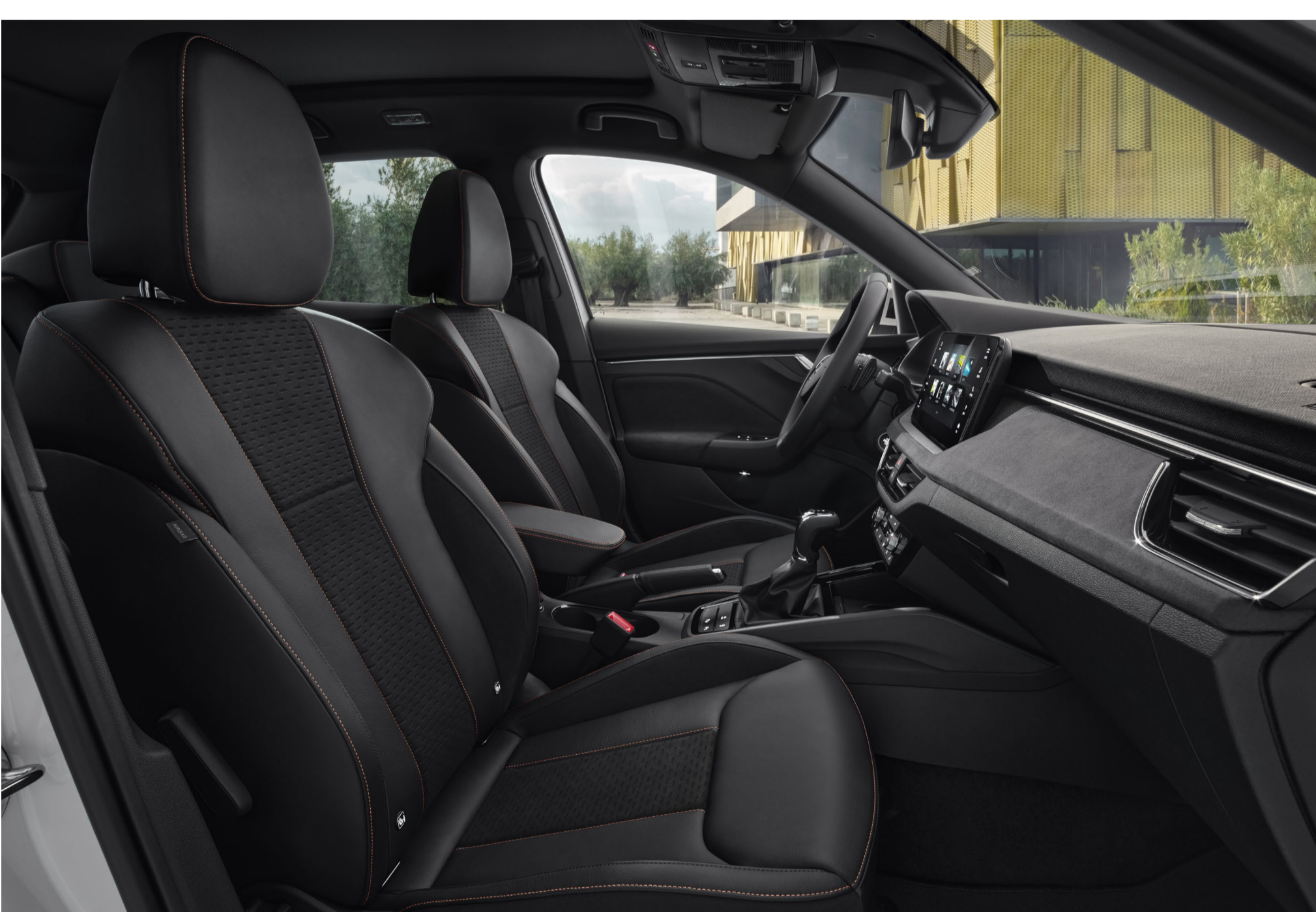
Interjeras „Monte Carlo“